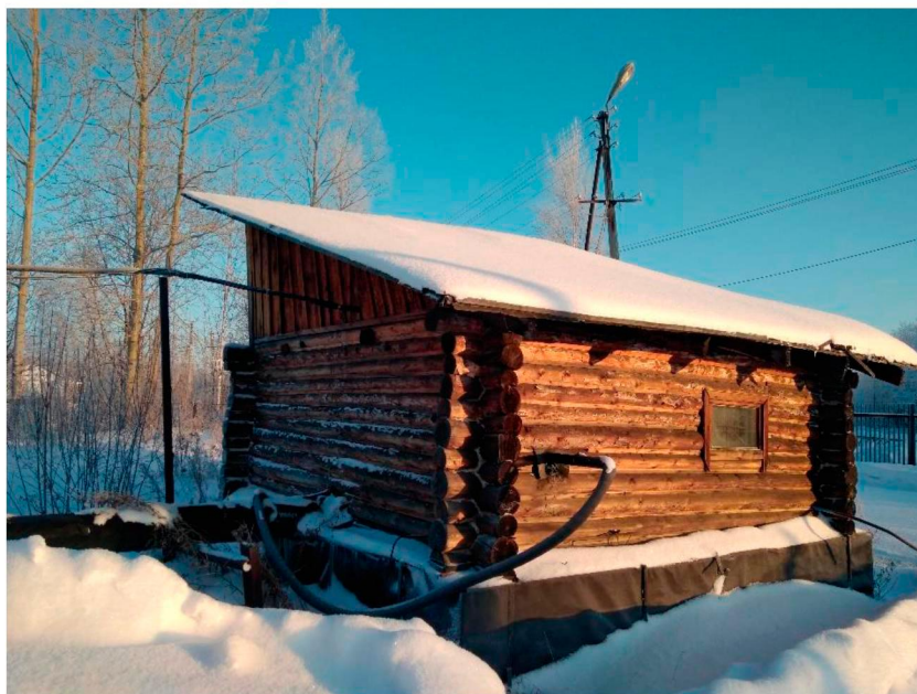
Павильон скважины № 2 п. Усть-Юган