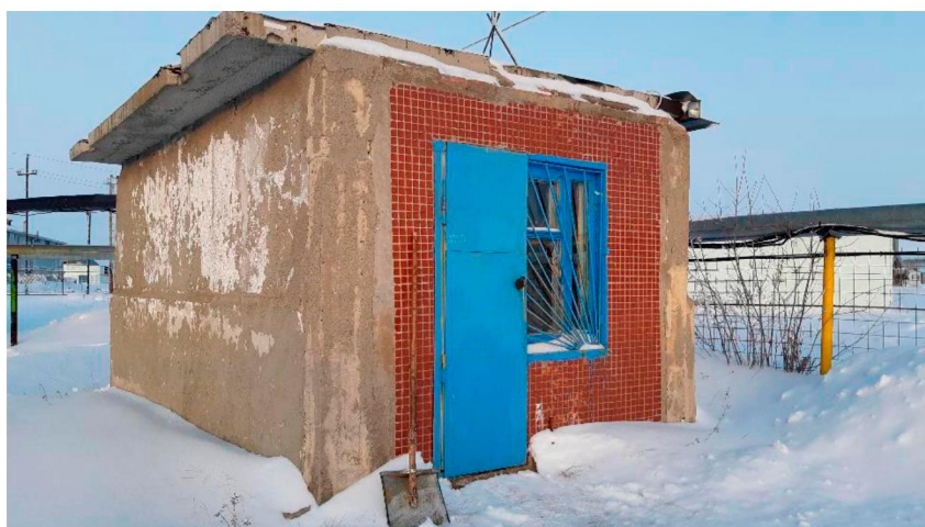
Павильон скважины № 3 п. Юганская Обь