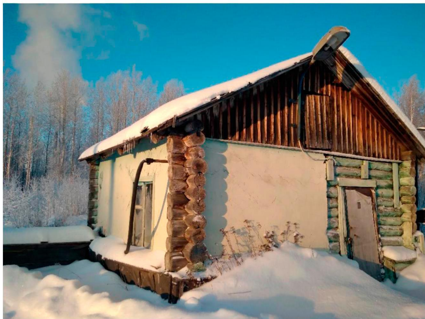
Павильон скважины № 1 п. Усть-Юган