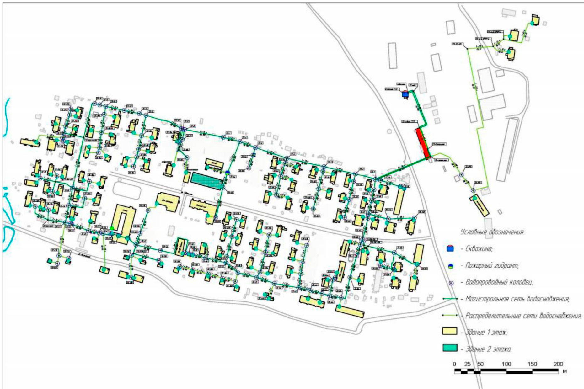
Существующая схема водоснабжения посёлка Юганская Обь.