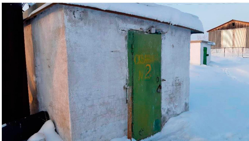
Павильон скважины № 2 п. Юганская Обь