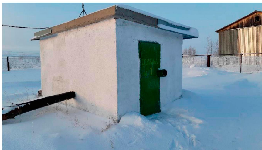
Павильон скважины № 1 п. Юганская Обь